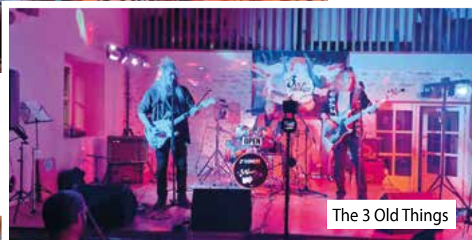
The 3 Old Things