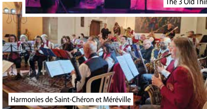
Harmonies de Saint-Chéron et Méréville