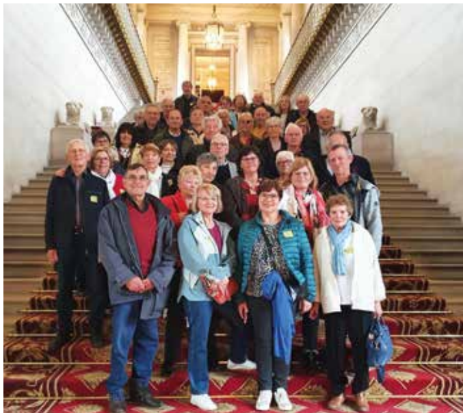
40 adhérents ont visité le Sénat le jeudi 2 mai !