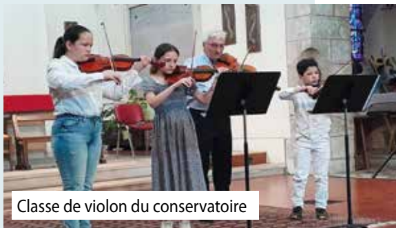
Classe de violon du conservatoire