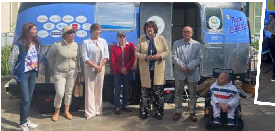
Inauguration du « Village des aidants » le 13 juin