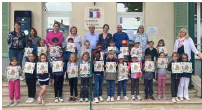
Maternelle du Pont de Bois