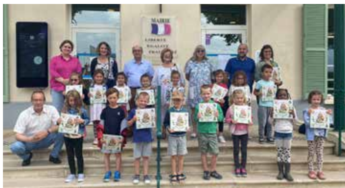
Maternelle du Centre